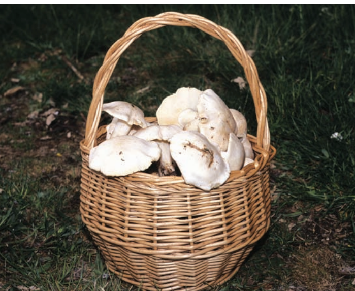
Cesta de Calocybe gambosa , especie objeto de una gran presión recolectora.