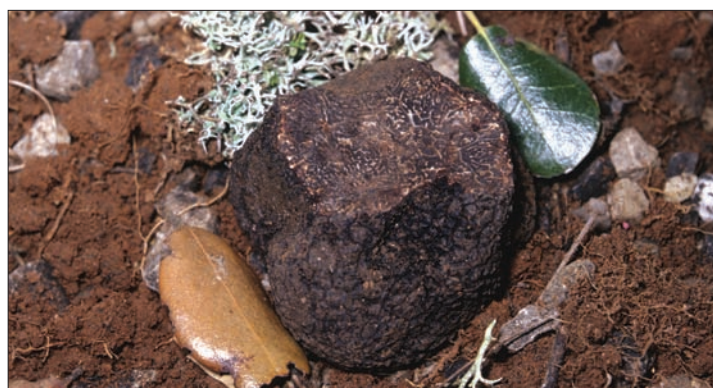
Tuber melanosporum , es la trufa sometida a una mayor presión recolectora.

Comparar las listas rojas de diferentes países para organizar el estatus internacional de especies implicadas.