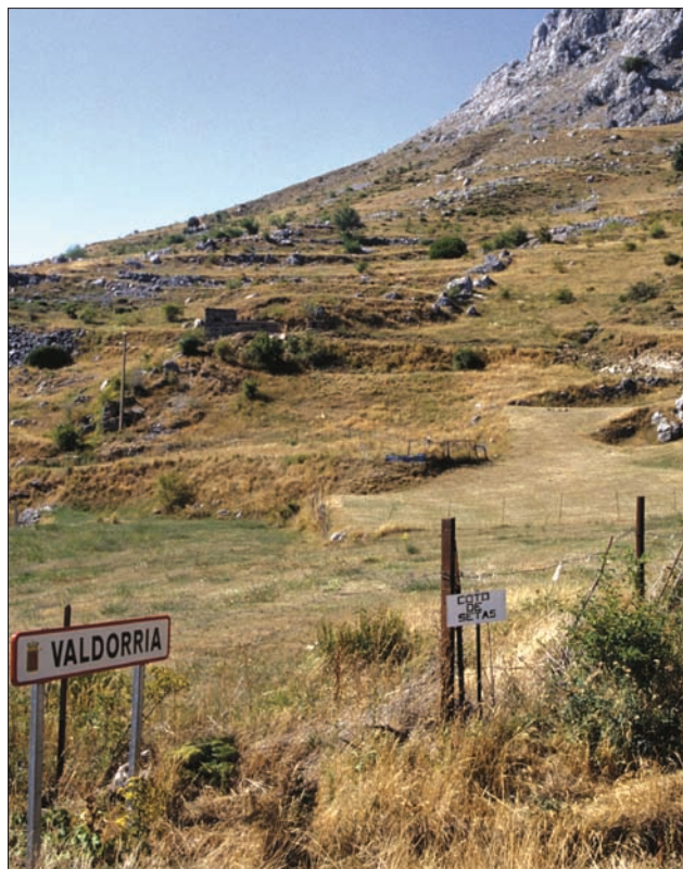
Coto de Calocybe gambosa , en la provincia de León.