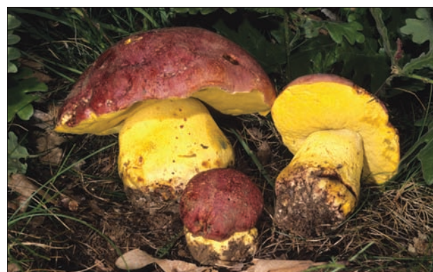
Boletus regius , especie termófila.

Los inventarios micológicos necesitan años de trabajo intensivo sobre el terreno y los que gestionan la Naturaleza, debido a las dificultades técnicas, excluyen a menudo los hongos de sus planes de acción.